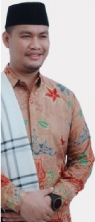
RYA JAYA RADES N BUPATI TUBABA